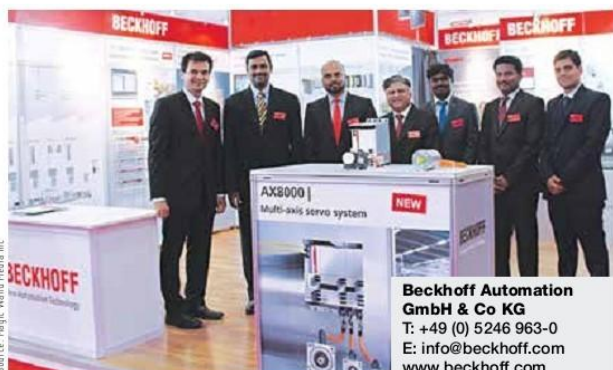
Beckhoff Automation GmbH & Co KG T: +49 (0) 5246 963-0 E: info@beckhoff.com www.beckhoff.com Hall & Booth: A - 18