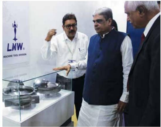
Hon'ble Minister of State for MSME, Govt. of India, Haribhai Parthibhai Chaudhary at LMW Booth at INTEC 2017