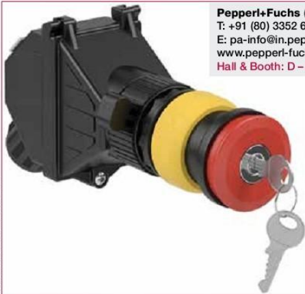
Pepperl+Fuchs (India) Pvt Ltd T: +91 (80) 3352 6000 E: pa-info@in.pepperl-fuchs.com www.pepperl-fuchs.in Hall & Booth: D - 280, 281, 301 & 302

The comprehensive line of switches, illuminated push buttons and emergency stop buttons are for hazardous areas.